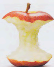
Per spiriti cre-attivi