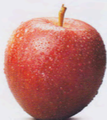
Per chi si emoziona