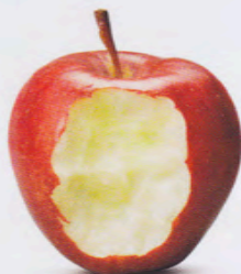
Per chi resta a bocca aperta